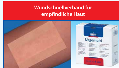
Wundschnellverband für empfindliche Haut