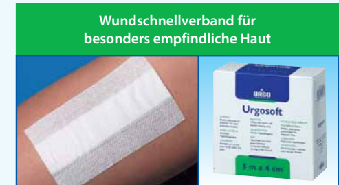
Wundschnellverband für besonders empfindliche Haut